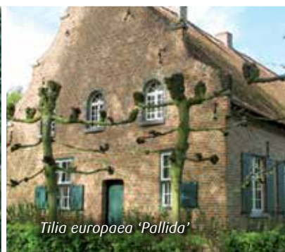
Tilia europaea 'Pallida'