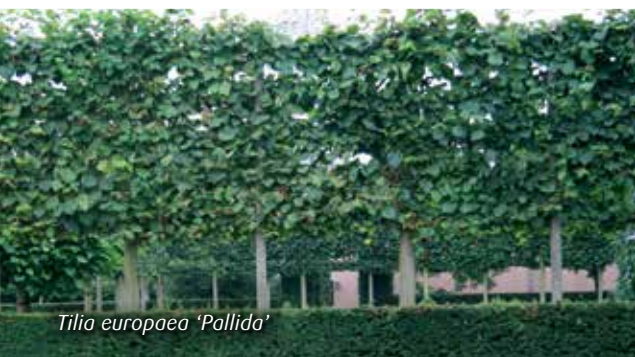
Tilia europaea 'Pallida'

Plant laagstammige fruitbomen voor het plukgemak (maximum 1,5 m tot 2 m). De meeste fruitbomen worden in een V of U-vorm aangeboden. Plant ze tegen een warme zuidmuur of als afscheiding in de tuin. Peren zijn de gemakkelijkste fruitsoort om in leivorm te houden.