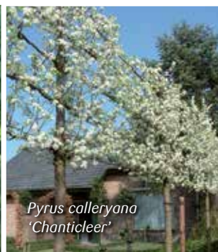
Pyrus calleryana 'Chanticleer'