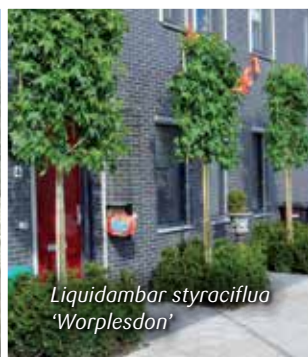
Liquidambar styraciflua 'Worplesdon'