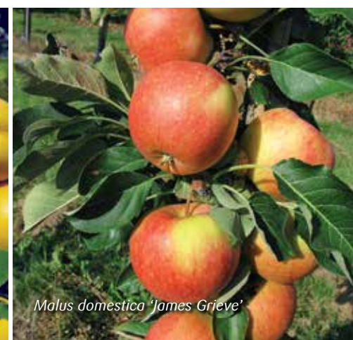
Malus domestica 'James Grieve'