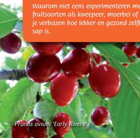
Prunus avium 'Early Rivers'