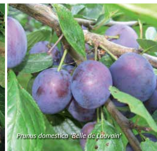
Prunus domestica 'Belle de Louvain'