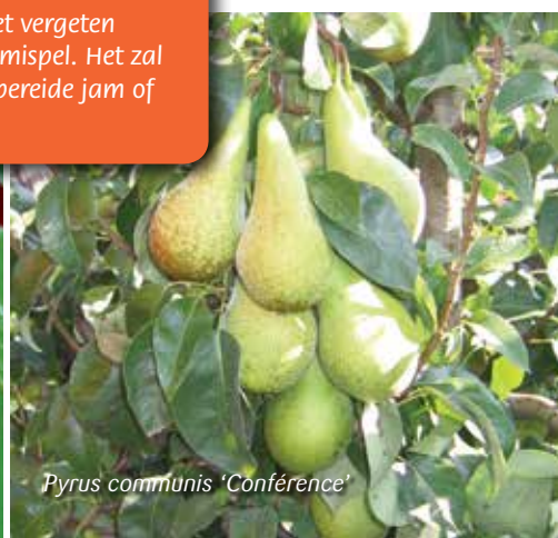
Pyrus communis 'Conférence'