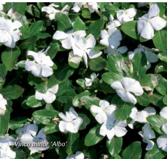
Vinca minor 'Alba'

Plant bloembollen tussen de bodembedekkers. Dit geeft een verrassend effect in het voorjaar.