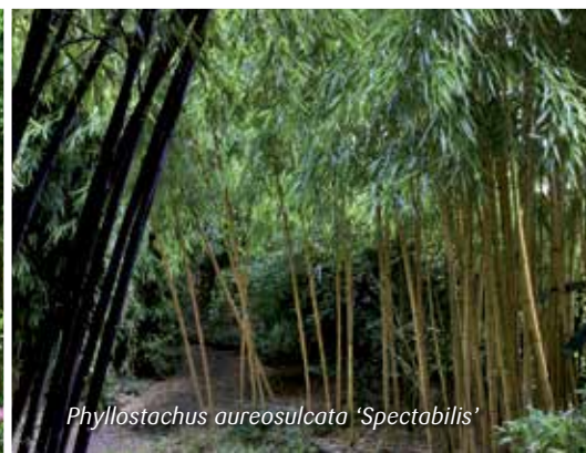
Phyllostachys aureosulcata 'Spectabilis'