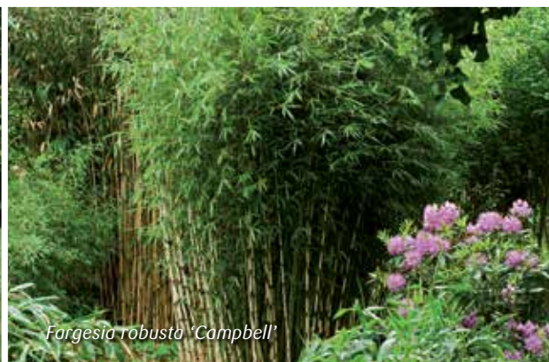
Fargesia robusta 'Campbell'